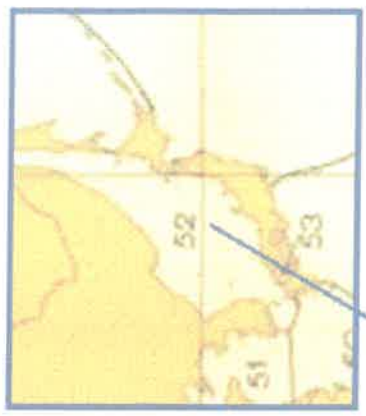
52- Japan Sea